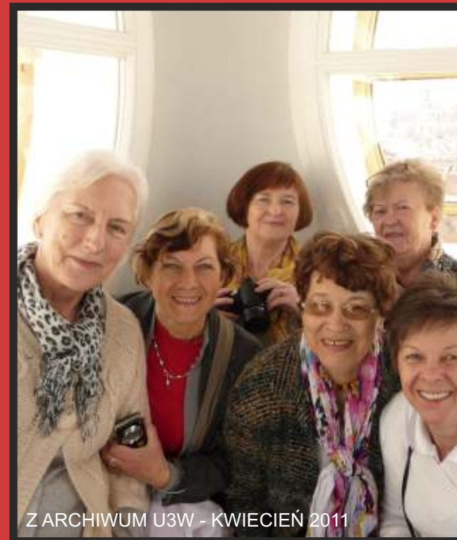
Z ARCHIWUM U3W - KWIECIEŃ 2011