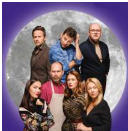
Teatr Studio Buffo reż. Marcin Hyncnar „Dobrze się kłamię”

To dzięki nim widzowie przeżyją niezwykle emocje, ale przede wszystkim będą się świetnie bawić.