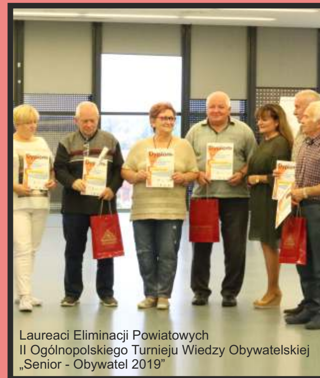
Laureaci Eliminacji Powiatowych II Ogólnopolskiego Turnieju Wiedzy Obywatelskiej „Senior - Obywatel 2019”