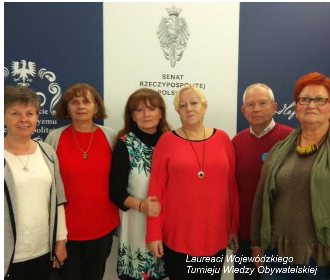
Laureaci Wojewódzkiego Turnieju Wiedzy Obywatelskiej